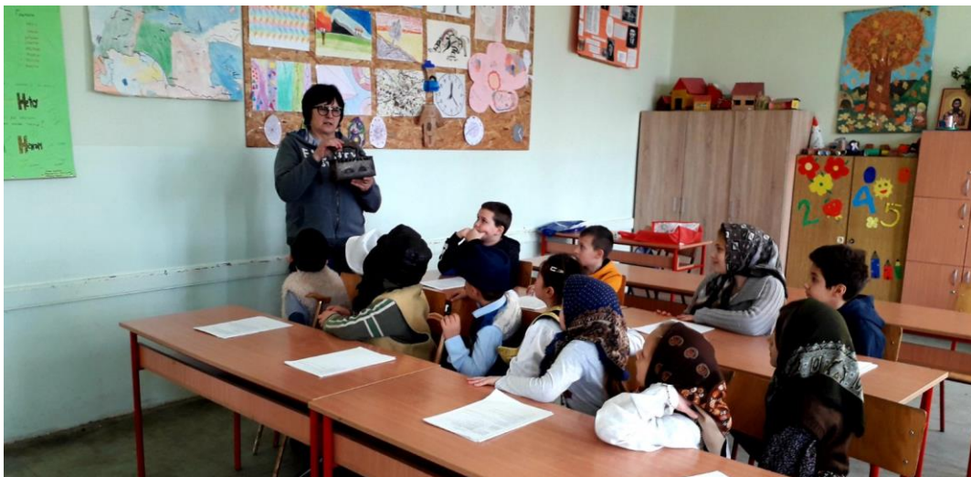
Живот у прошлости