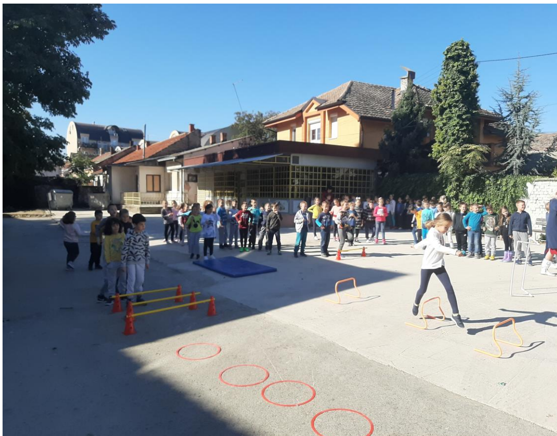
Спортски дан – полигон