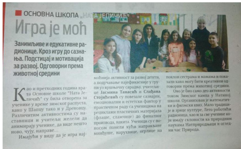
Ми у локалним медијима

Глас Подриња је писао о Зимском кампу у нашој школи, 13. фебруара.