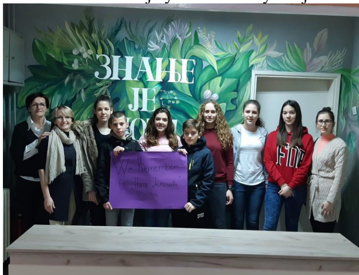
Међународни дан сећања на жртве Холокауста

Међународни дан сећања на жртве Холокауста - Светски јеврејски конгрес покреће већ четврту годину за редом кампању #WeRemember поводом Међународног дана сећања на жртве холокауста који се обележава 27. јануара. Појединци и организације широм света учествују тако што своју слику на којој држе натпис "We Remember" објављују на друштвеним медијима са hasthagom #WeRemember. Све фотографије се затим пројектују 72 сата на простору концентрационог логора Аушвиц као и уживо на Facebook LIVE-у, YouTube-у и Twitter-у. Сваки учесник помаже унапређењу глобалне борбе против антисемитизма, расизма, ксенофобије и мржње. Наша школа је учествовала у овој кампањи.