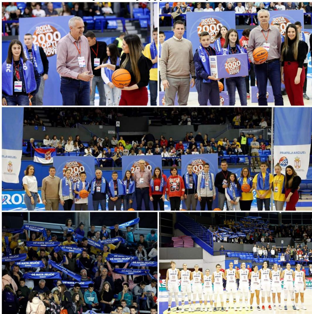
20 кошаркашких лопти за нашу школу

присутствовало међународној кошаркашкој утакмици Србија - Турска и том приликом је уручена награда.