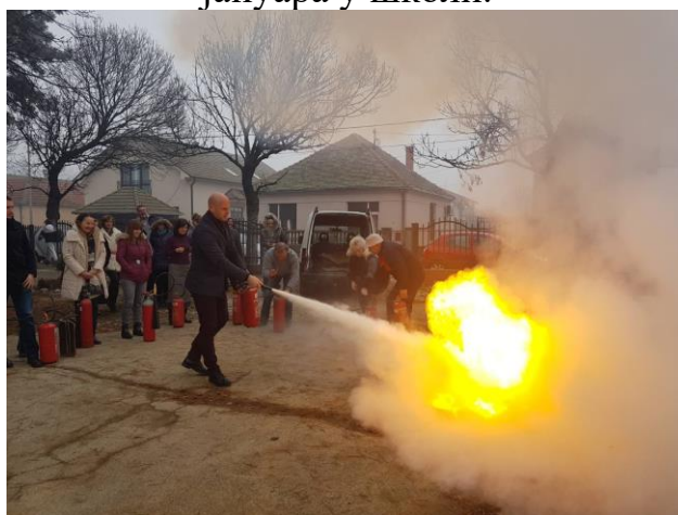
Обука противпожарне заштите

Обука противпожарне заштите, за раднике школе, реализована је 16. јануара у школи.