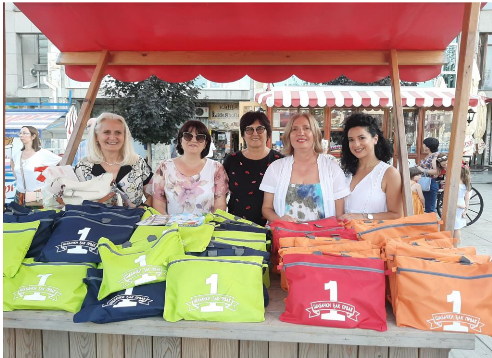
Учитељице првог разреда и учитељица из продуженог боравка деле поклоне првацима