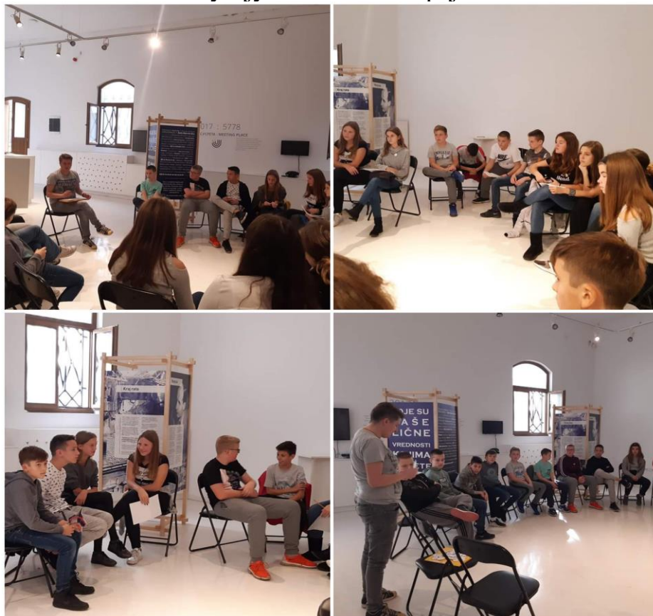
Буди носилац промене

У петак, 15. новембра, имали смо последњу радионицу у оквиру пројекта "Раул Валенберг - Буди носилац промене". Радионица је одржана у Музеју шабачких Јевреја.