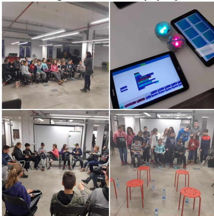
Радионица програмирања Sphero роботића

Радионицу је организовало удружење SEE ICT, чији део је и Startit у оквиру пројекта "Learning for the 21st century" у сарадњи са UNICEF-ом.