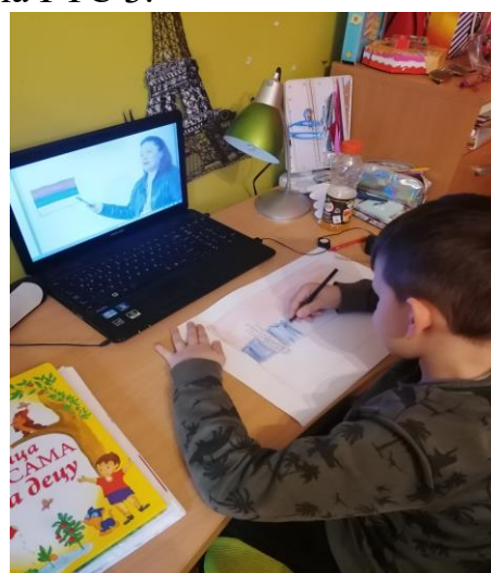
Ликовна култура – застава Србије