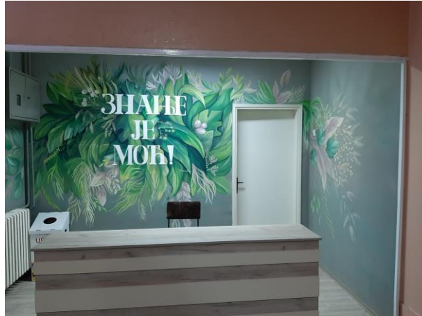
Простор за дежурног ученика на главном улазу школе