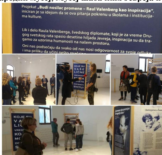
Изложба посвећена Раулу Валенбергу