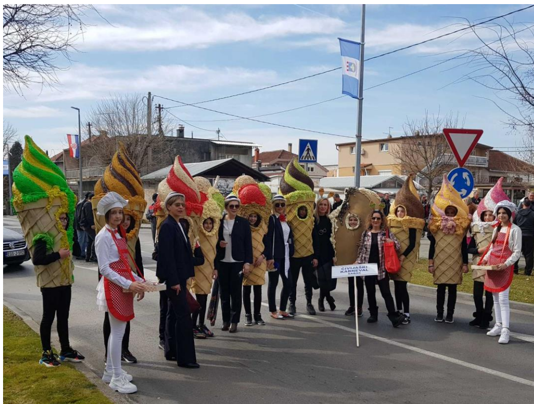
Разиграни сладоледи на Међународном карневалу