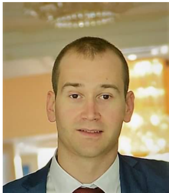
Александар – Вуковац 2001/2002.г.