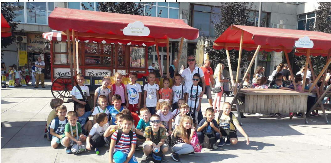
Пажљивкова правила - 1/3 на тргу