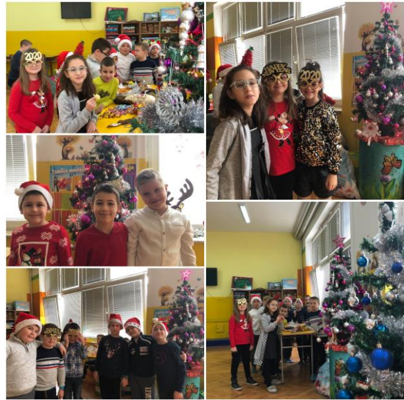
Журка у продуженом боравку

Натин колектив на новогодишњој прослави у “Мотелу” на Сави, 26. децембра.