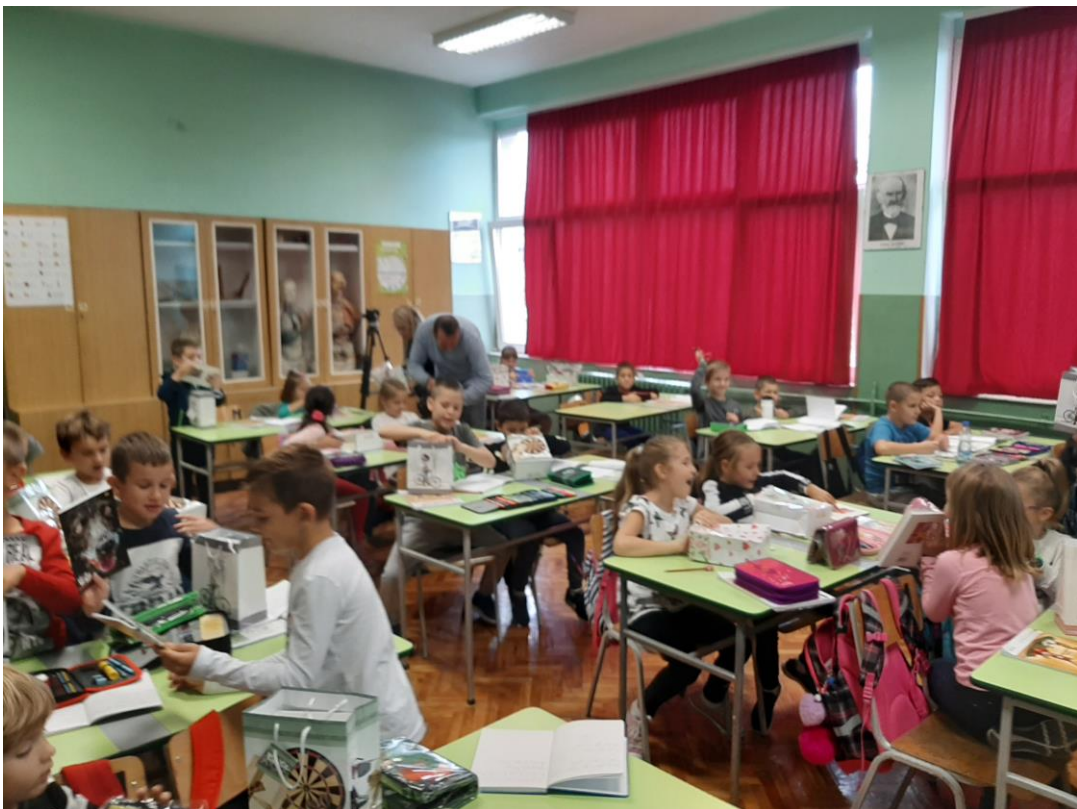
Поклони нашим првацима