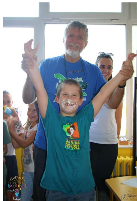
Ђорђе Бакић II/1

У школи је, 12. септембра, првацима одржано предавање о безбедности деце у саобраћају . Предавање је одржао полицајац.