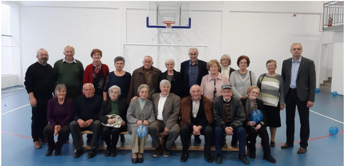
Натини пензионери са директором и помоћником школе