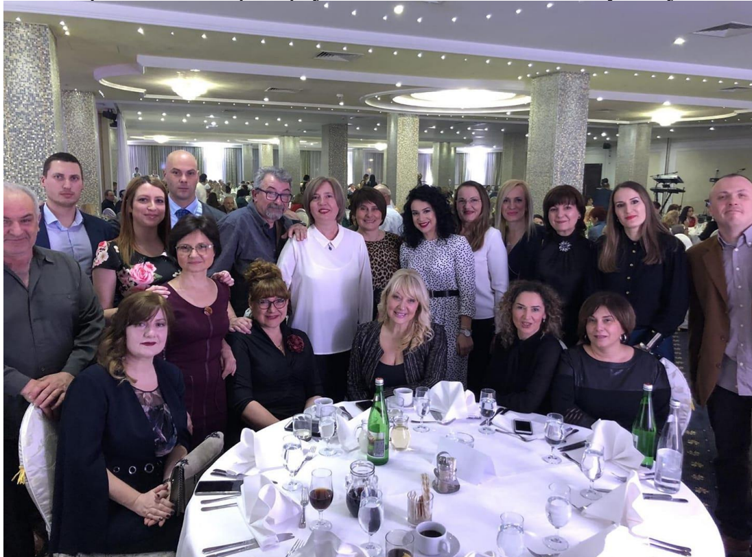
Ми на балу

Светосавски бал је реализован 27. јануара, у хотелу “Слобода”, за све просветне раднике на територији општине Шабац. На балу нас је било 20.