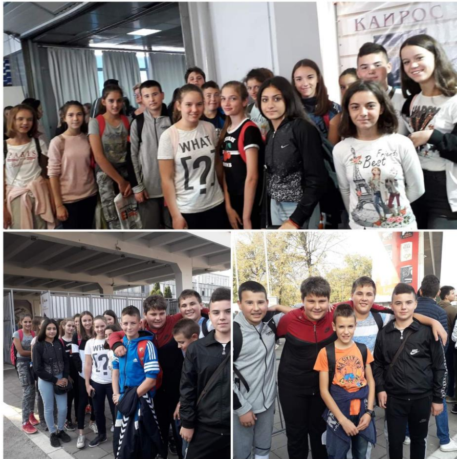
Ученици из Дреновца на сајму

Ученици 6. и 7. разреда из Дреновца, 26. октобра, посетили су Сајам књига у Београду.