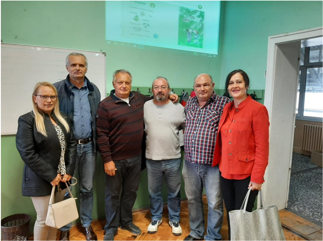
МЗ Камичак са директором и помоћником

МЗ Камичак је, 4. октобра, поклонила нашим првацима школски прибор (перницу и две свеске). Од 5. октобра наша школа, поред фејсбука и сајта, има и ИНСТАГРАМ налог.