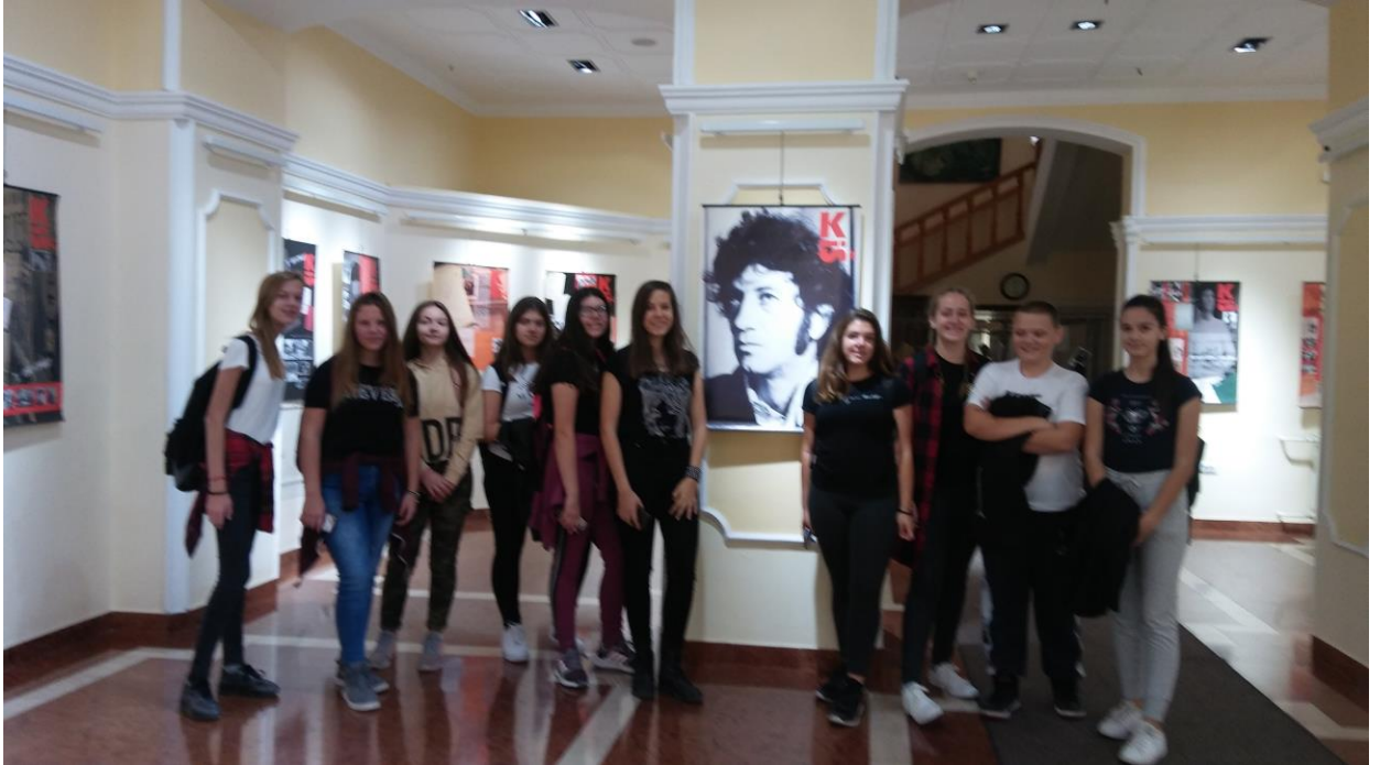
Осмаци на изложби

Изложбу посвећену Данилу Кишу, у градској библиотеци, ученици осмих разреда су посетили 25. октобра.