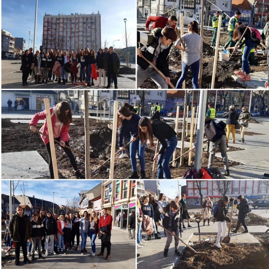
Садимо дрвеће са градоначелником