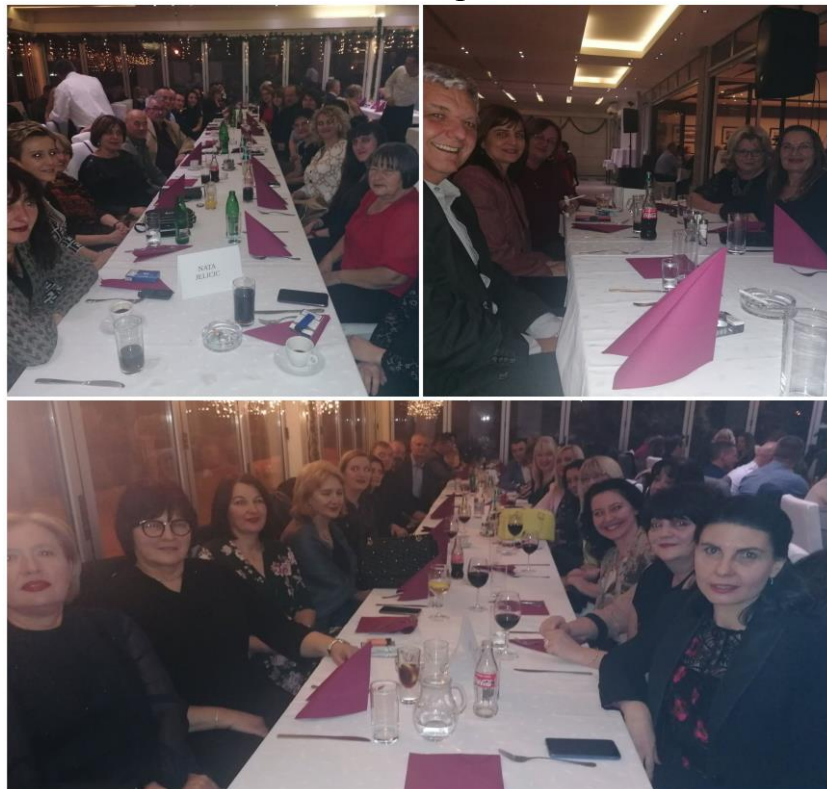
Новогодишња прослава на “Мотелу”

Натин колектив на новогодишњој прослави у “Мотелу” на Сави, 26. децембра.