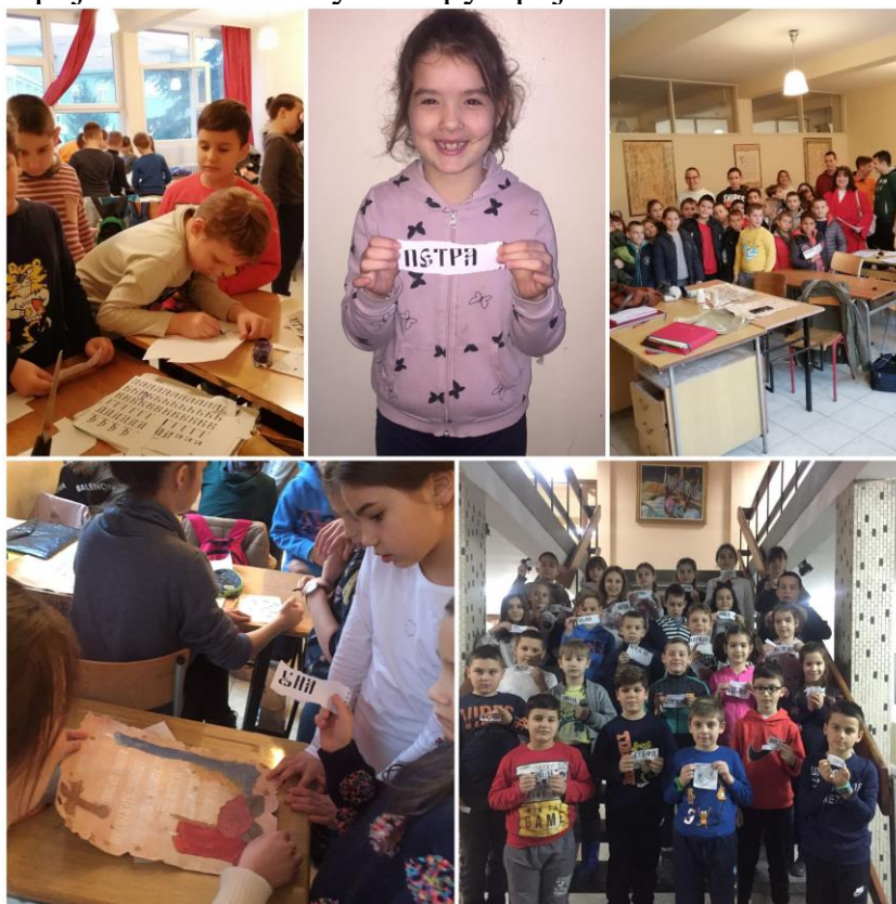
Лепа слова лепо пиши

Ученици другог разреда су 21. јануара, у Школи примењених уметности, имали час пројектне наставе у оквиру пројекта “Лепа слова лепо пиши”.