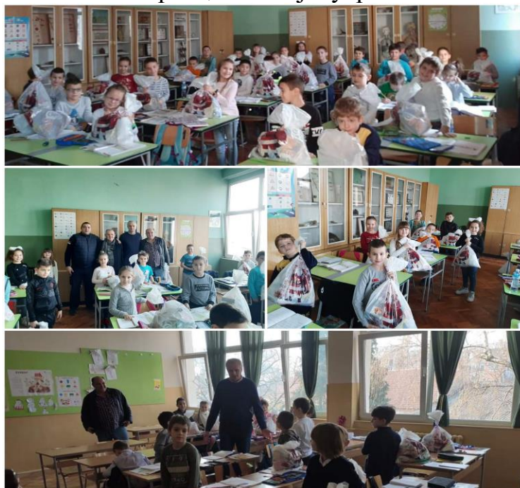
Пакетићи за прваке

МЗ “Камичак” је, поводом Светог Саве, поделила пакетиће нашим првацима 24. јануара.