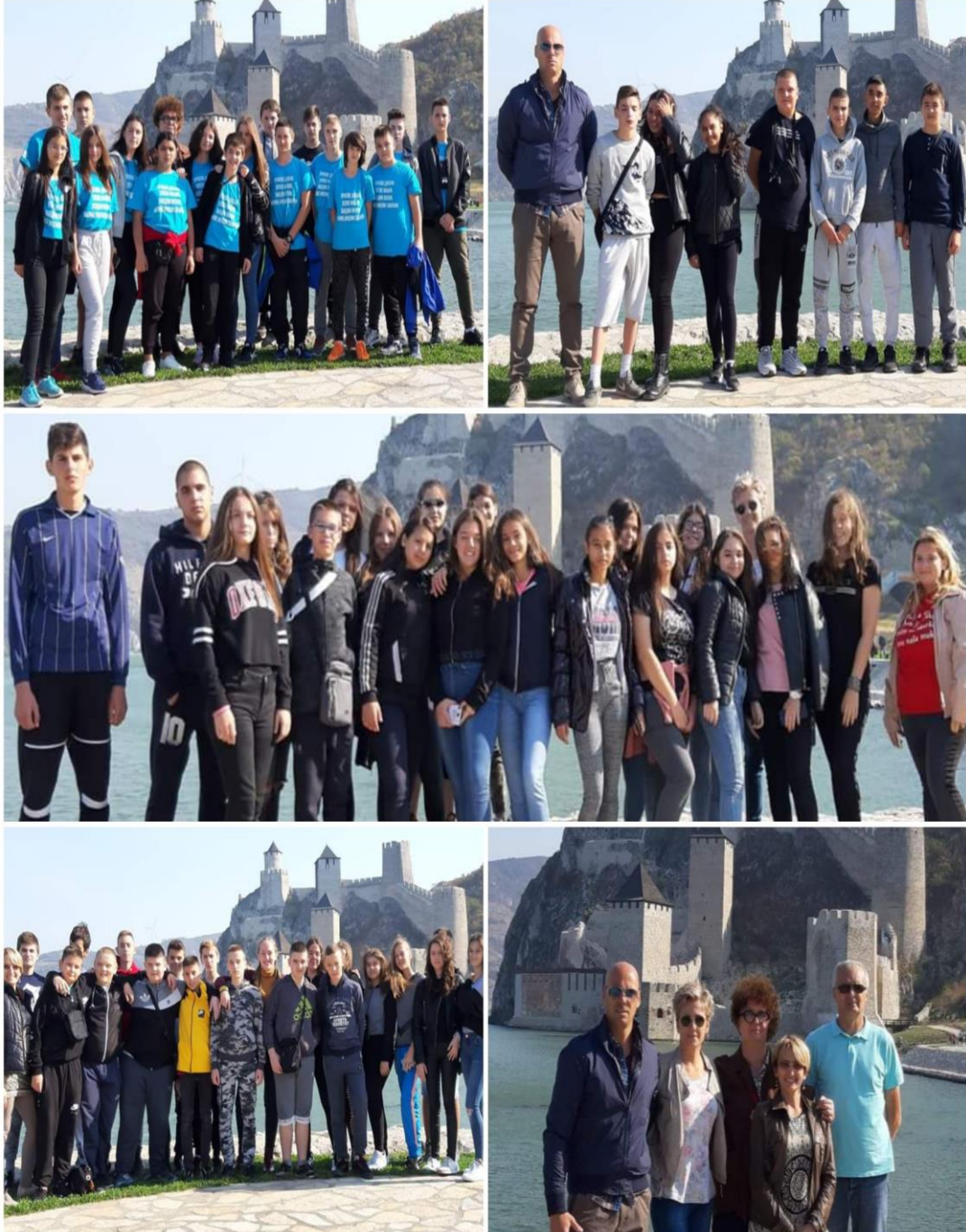
Екскурзија осмог разреда

У школи је 20. октобра реализован семинар “Развој дигиталних компетенција”, за учитеље и наставнике.