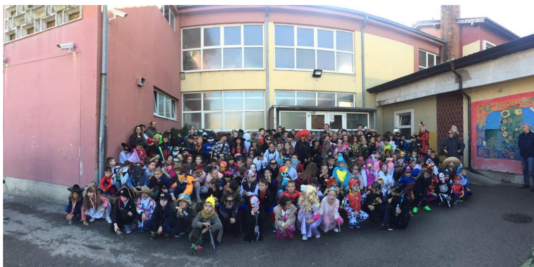
Маскенбал у Шапцу