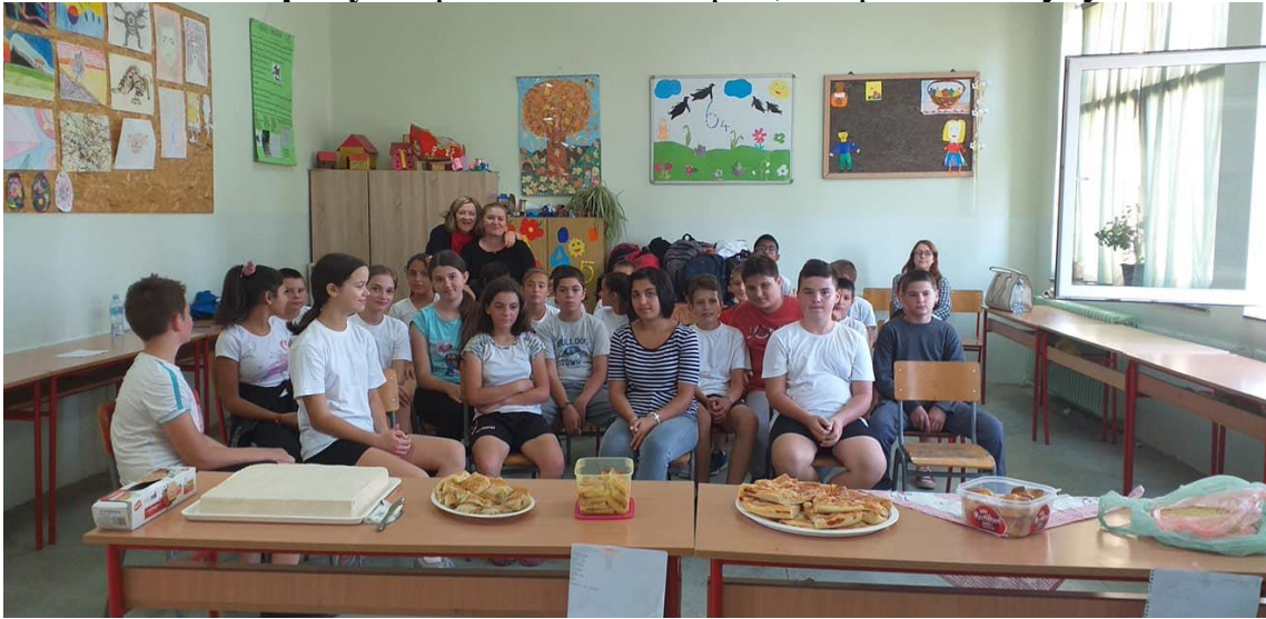
Европски дан језика у Дреновцу