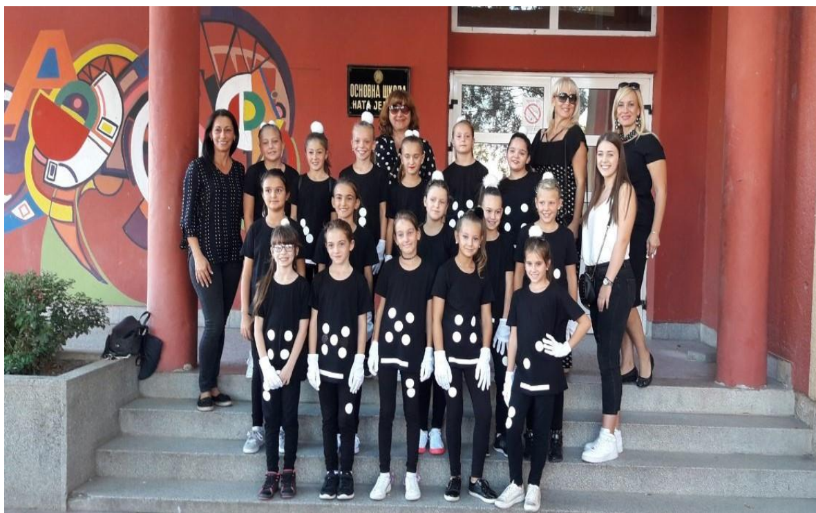
Чивијашки карневал – Домине