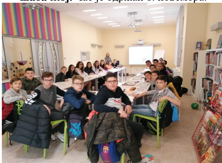
Час поводом Дана примирја