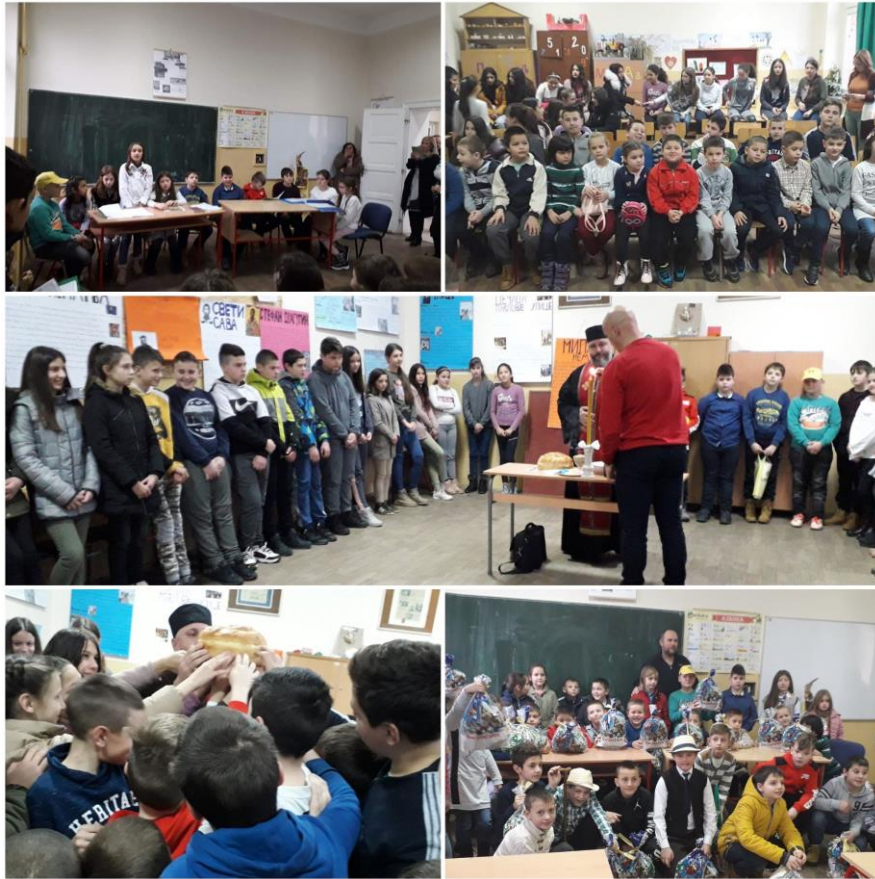
Школска слава у Дреновцу и подела пакетића

Светосавски бал је реализован 27. јануара, у хотелу “Слобода”, за све просветне раднике на територији општине Шабац. На балу нас је било 20.