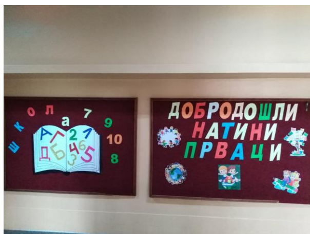
Пано за добродошлицу првацима

Онлајн настава на ТВ-у завршила се 29. маја.