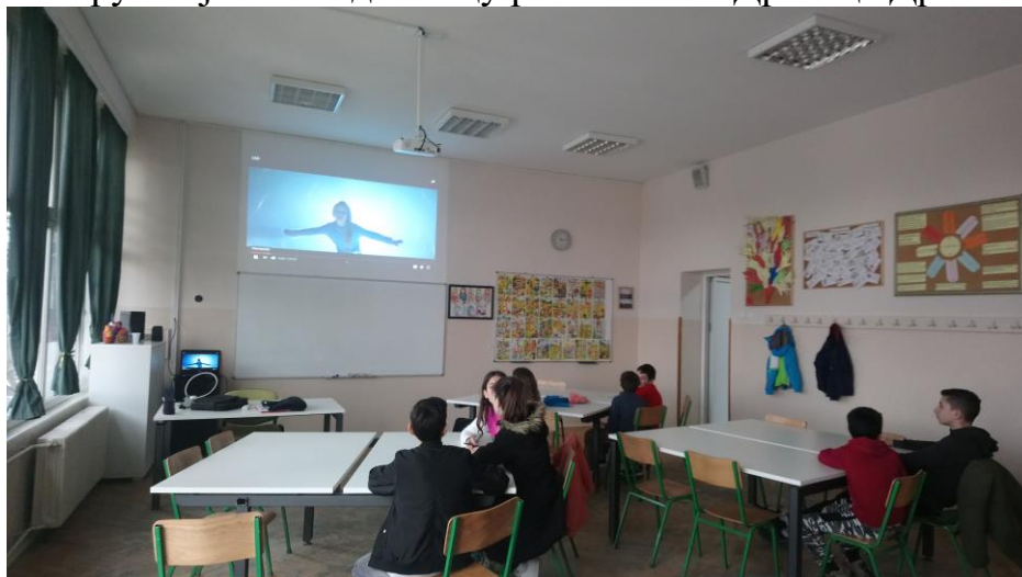
“Kahoot” квиз – филм