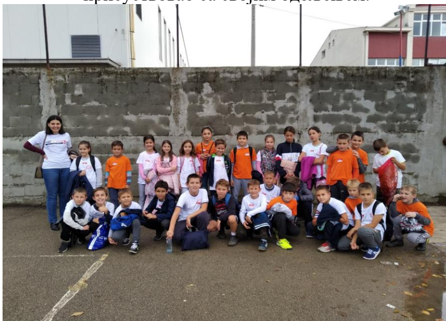
Спортски изазов - трећи и четврти разред