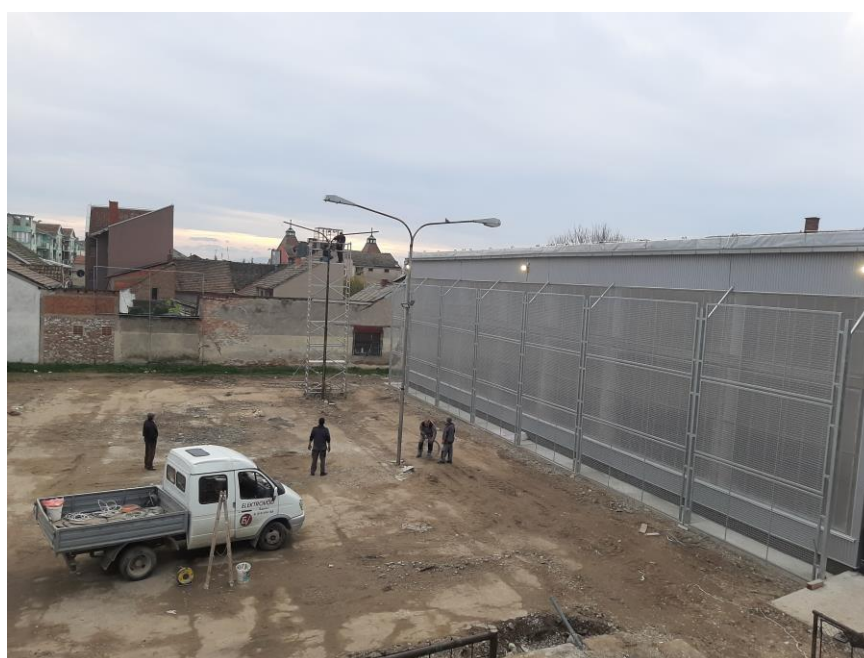
Фискултурна сала, 15.11.2019.г.