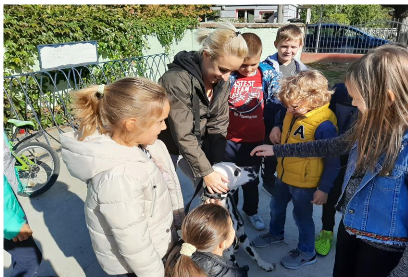
Изложба кућних љубимаца