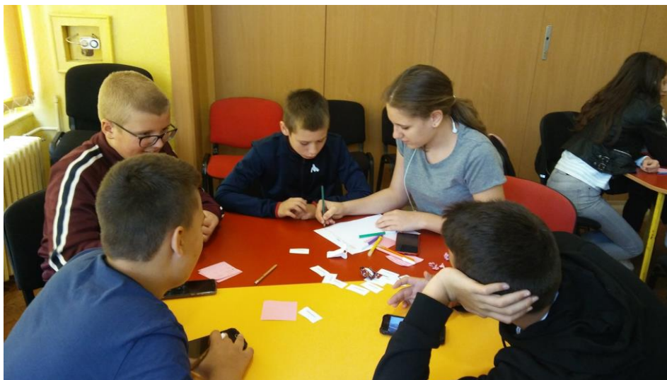
Буди носилац промена