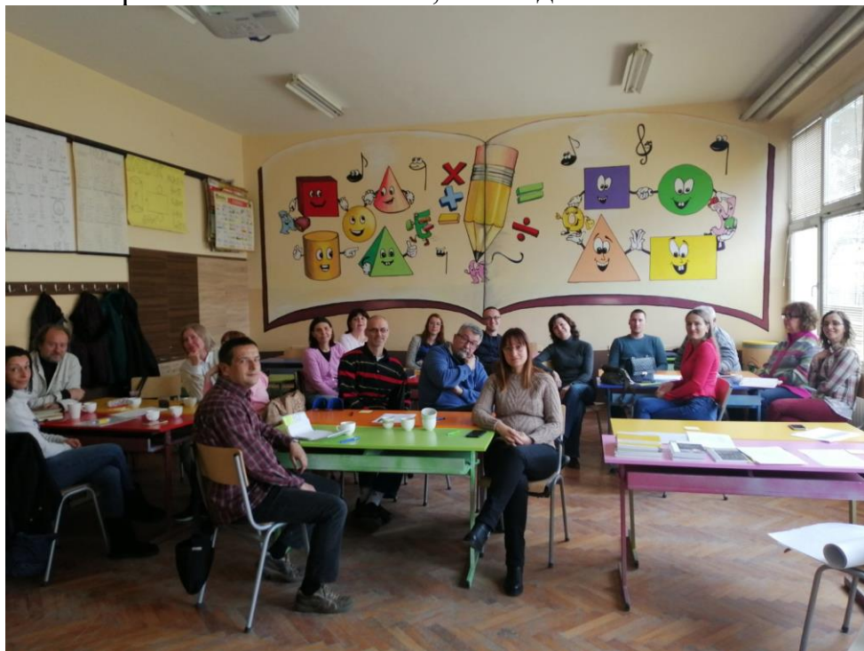
Планирање, израда и вредновање ИОП-а