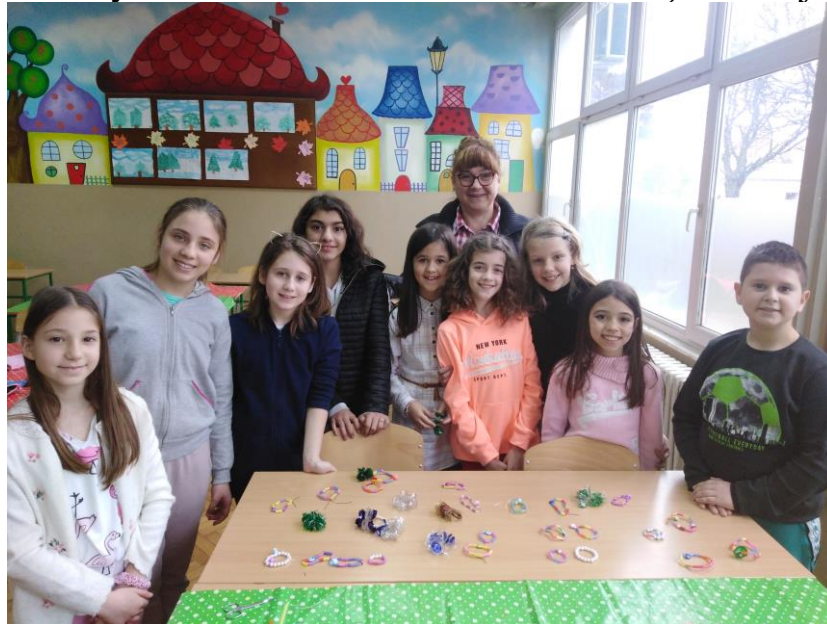
Рециклажа – прављење накита