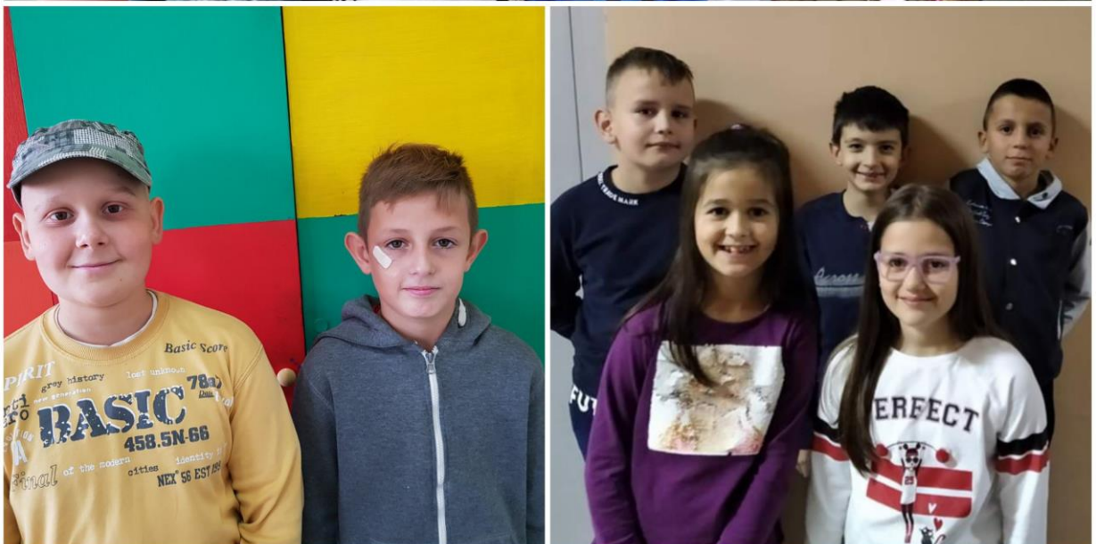
Наши математичари трећег и четвртог разреда

Наша школа је учествовала у наградној игри компаније Рода "2000 лопти за будуће асове" . У тој наградној игри наша школа је освојила прво место и као награду добила 20 кошаркашких лопти . У среду, 14. новембра, двадесет ученика у пратњи директора и помоћника школе је