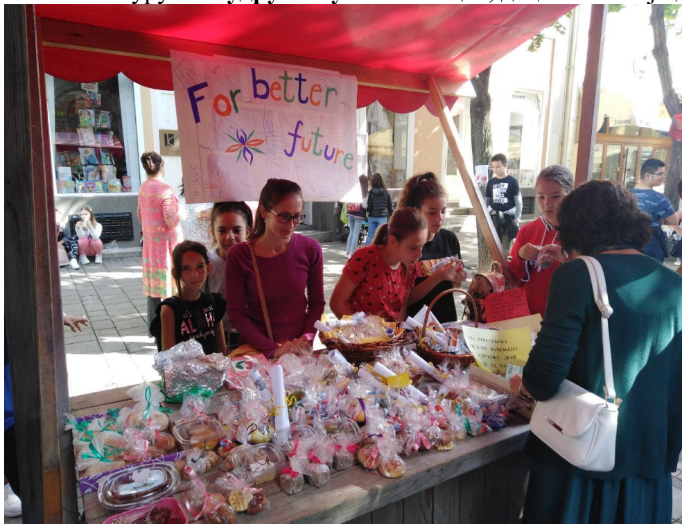
Европски дан језика – наш штанд