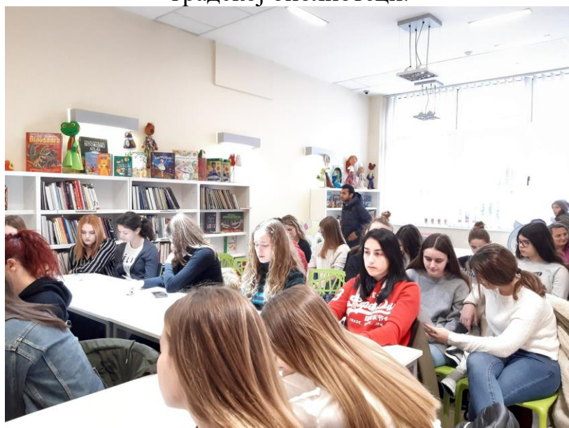
Национални дан књиге

Поводом Националног дана књиге, 28. фебруара , наши осмаци су учествовали у радионици посвећеној “Раним јадима“ Данила Киша у градској библиотеци.