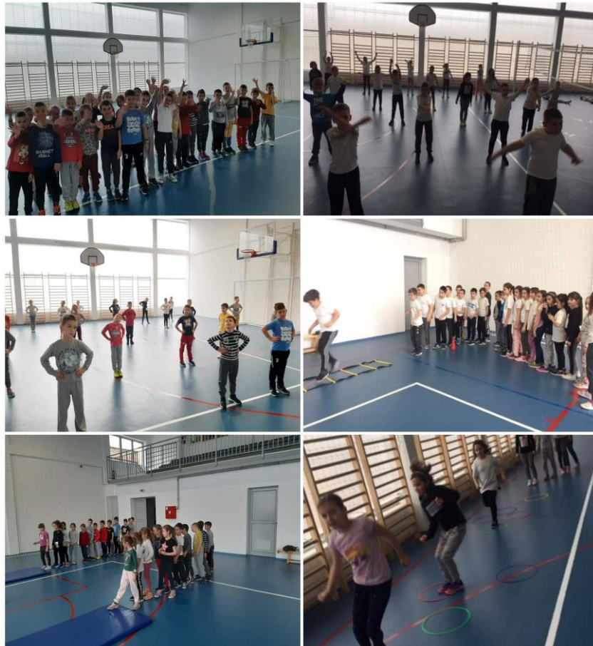
Први часови физичког васпитања у сали

Натина сала је добила употребну дозволу за време зимског распуста, а часове физичког васпитања реализујемо од 24. фебруара , када је и почело друго полугодиште.