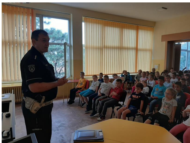
Безбедност деце у саобраћају

У школи је, 12. септембра, првацима одржано предавање о безбедности деце у саобраћају . Предавање је одржао полицајац.