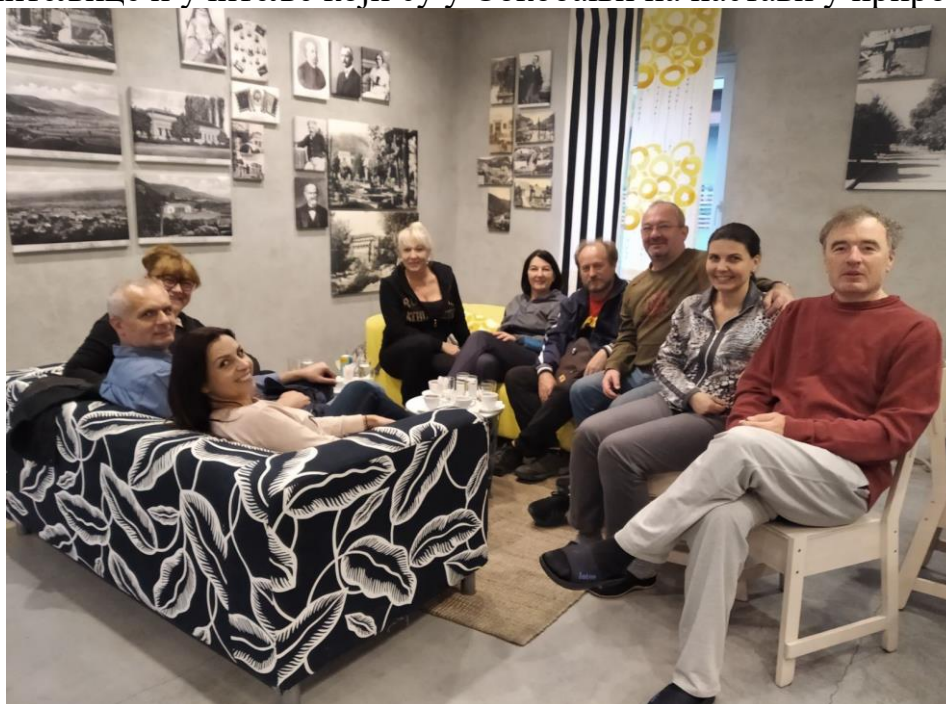
Сокобања – посета

Директор и помоћник директора, 1. новембра, посетили су ученике, учитељице и учитеље који су у Сокобањи на настави у природи.