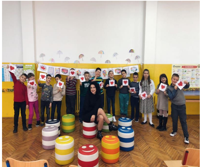
Приредба за 8. март у продуженом боравку

Приредбе за 8. март реализовали су ученици 2/3 и у продуженом боравку са својим учитељицама.