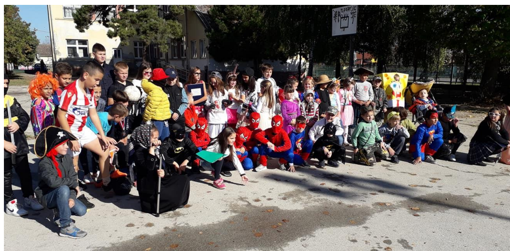
Маскенбал у Дреновцу