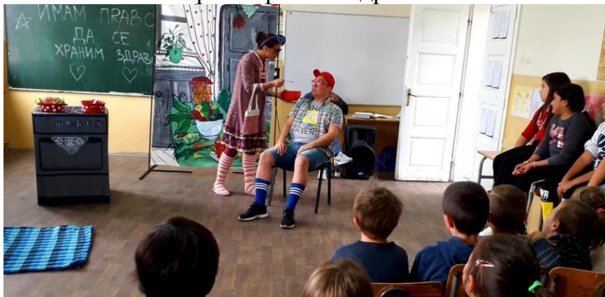
Имам право да се храним здраво

У Дреновцу је ученицима од 1. до 4. разреда одржана представа “Имам право да се храним здраво” , 4. октобра. Ученици су научили како се треба хранити здраво.