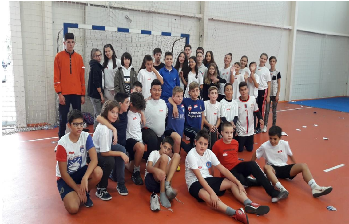
Спортски изазов – ученици од петог до осмог разреда