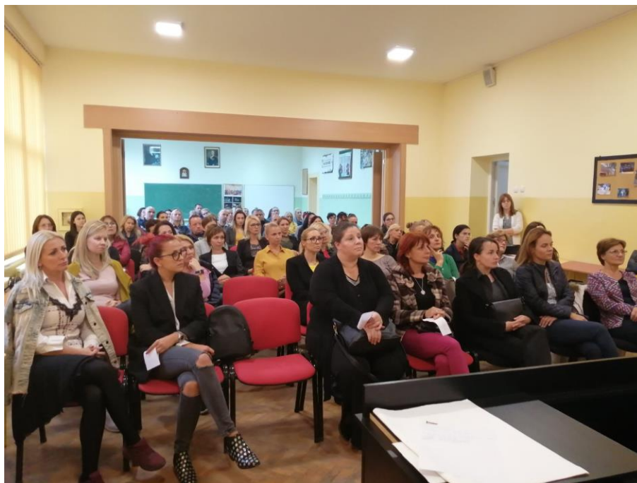
Трибина “Деца у дигиталном добу”