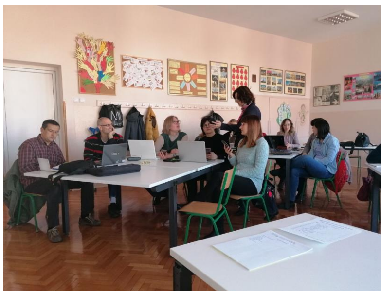
Израда онлајн упитника, квизова и тестова