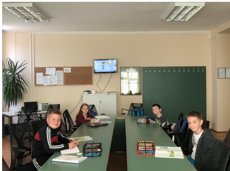
Продужени боравак од 11. маја

Екскурзије од I – VII разреда нису реализоване због корона вируса.