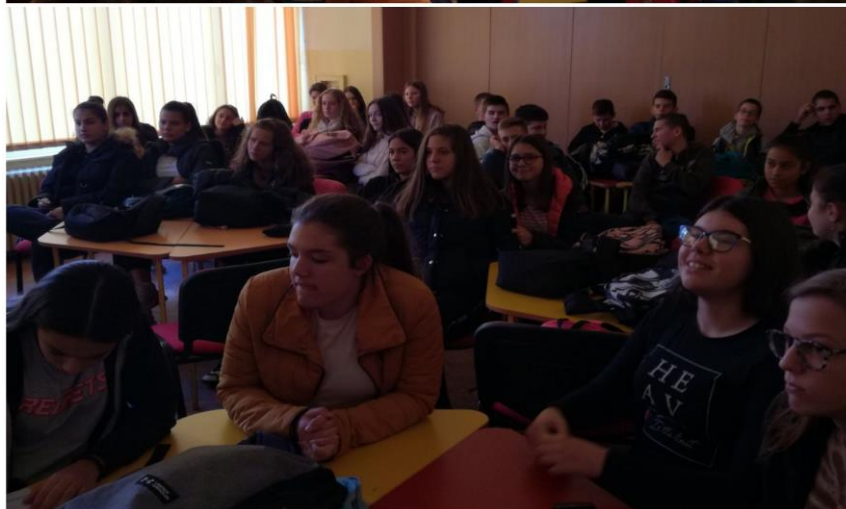
Трибина за осмаке

Директор и помоћник директора, 1. новембра, посетили су ученике, учитељице и учитеље који су у Сокобањи на настави у природи.