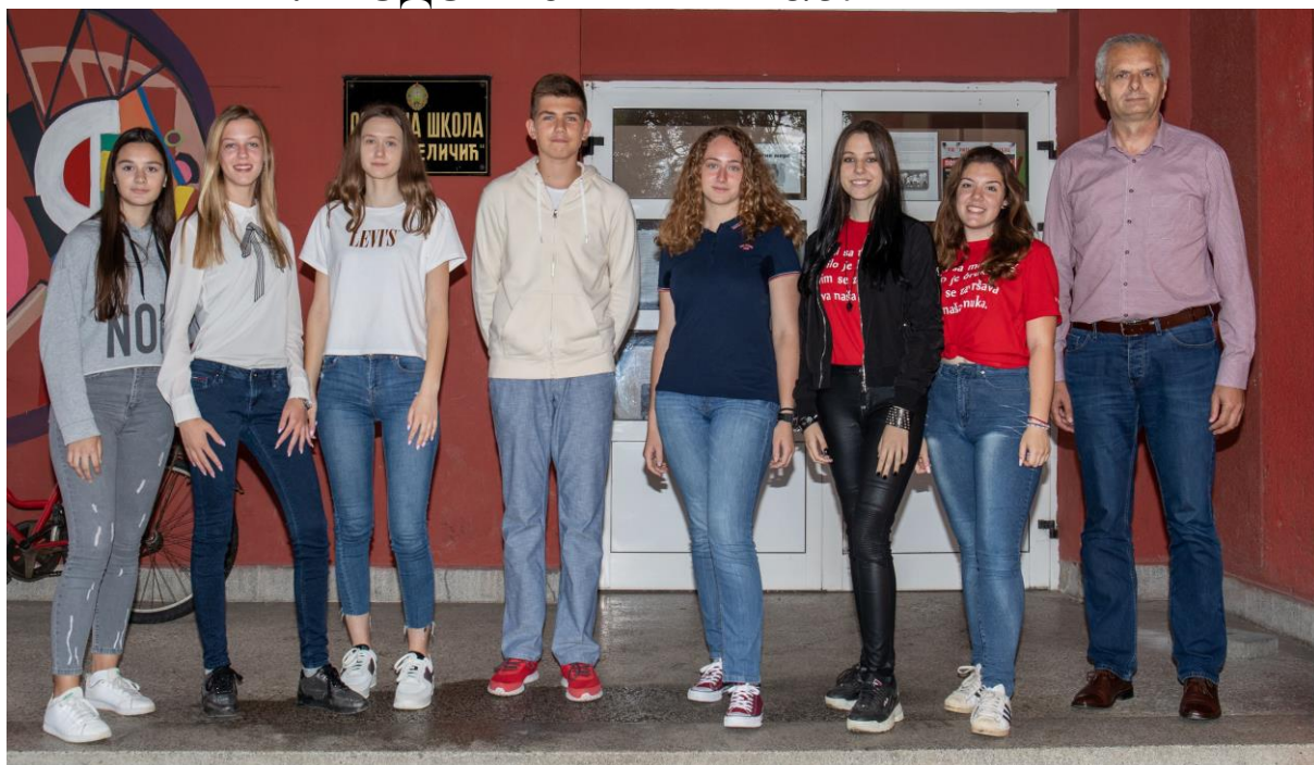
Вуковци са директором