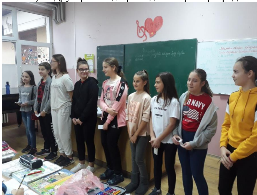
Волонтери честитају Дан детета

Дан детета, 20. новембар, секција "Волонтер у срцу" честитала својим млађим другарима од првог до четвртог разреда.