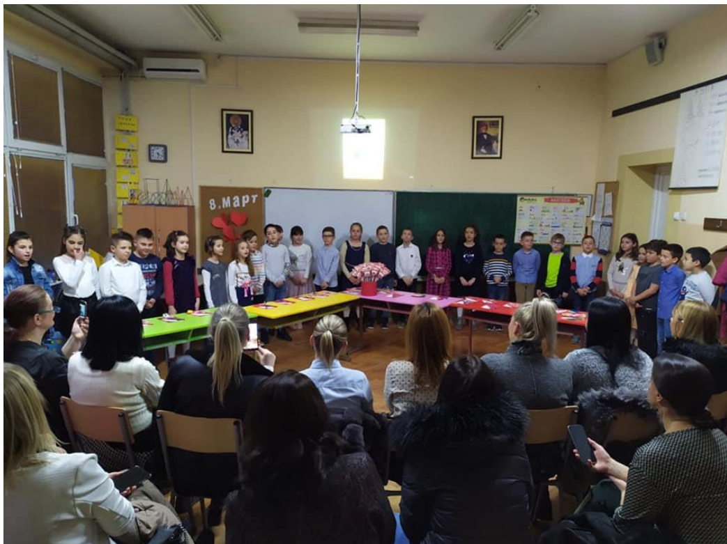
Приредба за 8. март ученика 2/3

Приредбе за 8. март реализовали су ученици 2/3 и у продуженом боравку са својим учитељицама.