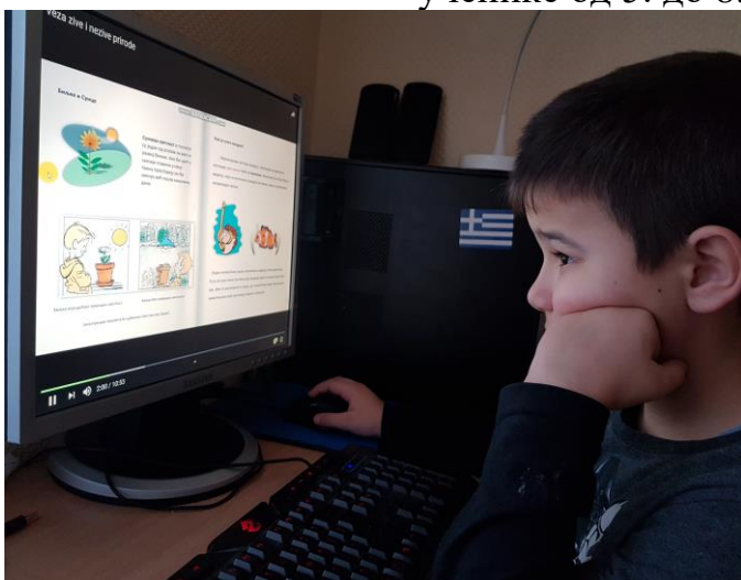
Часови на даљину - Свет око нас- Жива и нежива природа

Од 23. марта часови за ученике од 1. до 4. разреда емитују се на РТС 2, а за ученике од 5. до 8. на РТС 3.