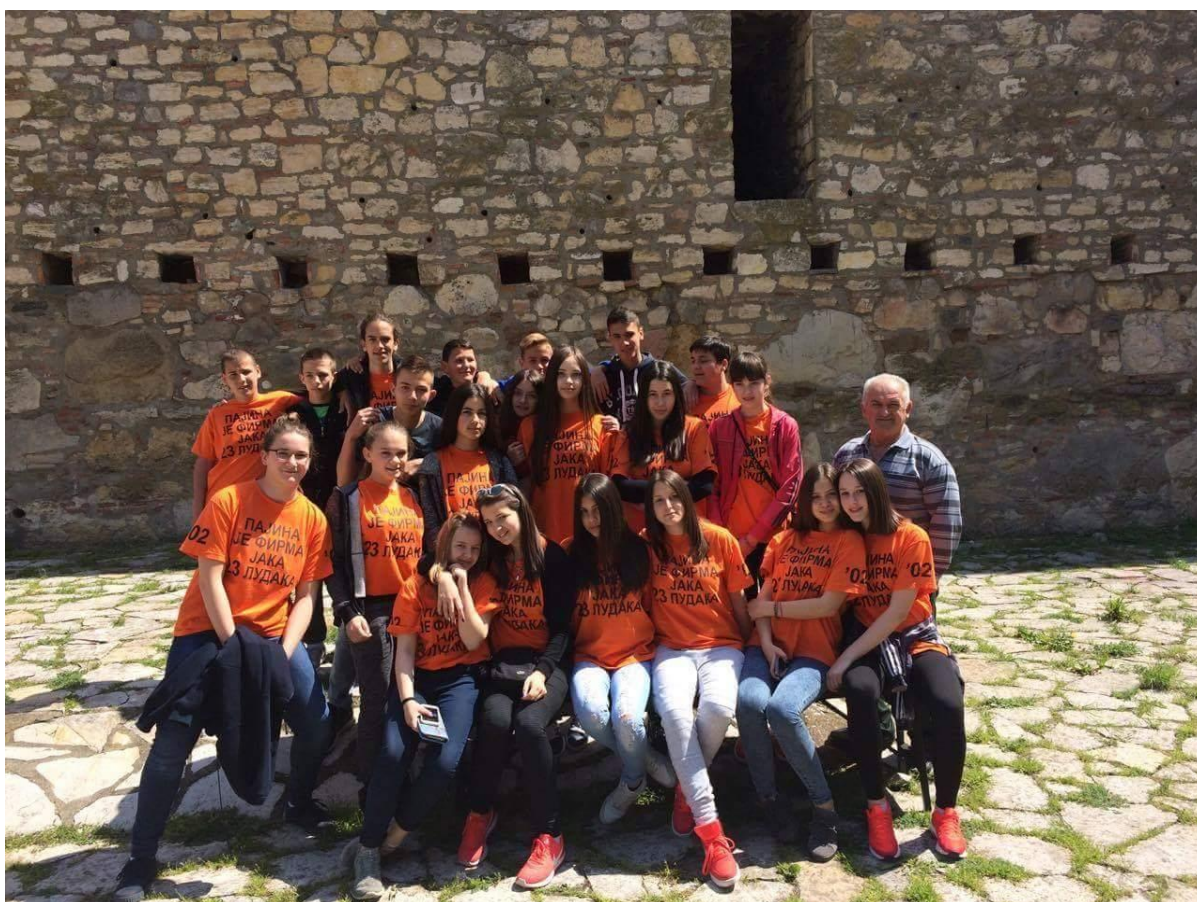
Екскурзија осмака – VIII/1