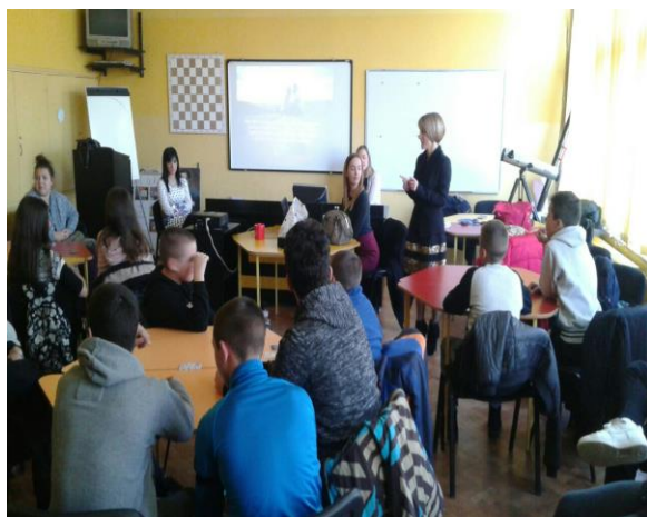
Воли сигурно! Буди победник! – предавање о сиди

Нова година и Божић – Приредбе поводом Нове године реализовале учитељице и ученици: I/1, I/3, I/4 и III/3.