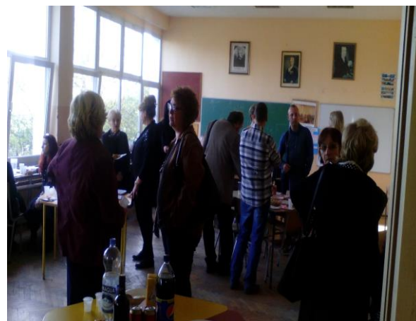
Коктел у школи