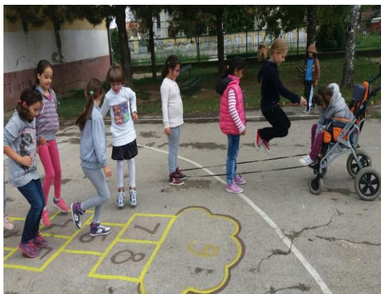
Игре без граница