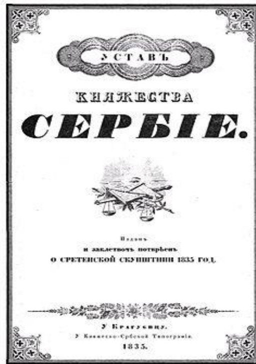
Насловна страна Сретењског устав