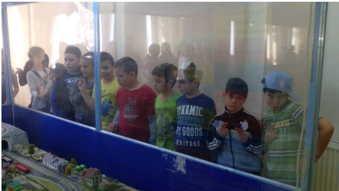
Макета - Свет око нас