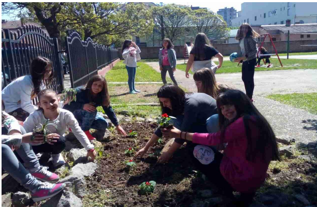
Дан планете Земље – IV разред сади цвеће