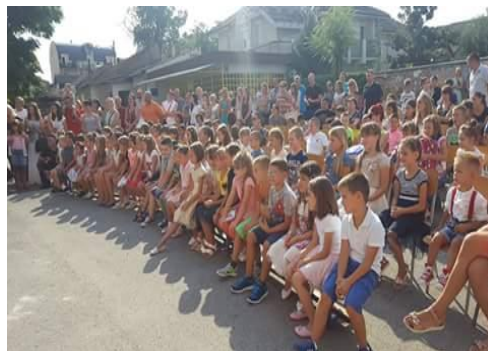
Свечани пријем првака у школском дворишту