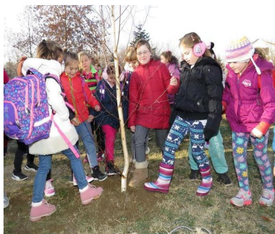
Прваци саде дрвеће у Великом парку