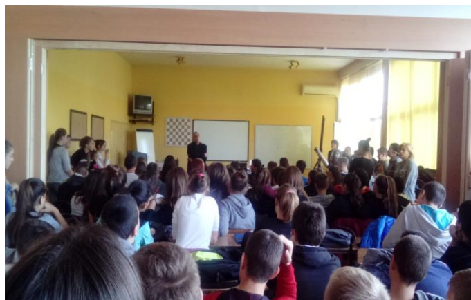
Трибина „Безбедност деце на Интернету“

Октобарски салон – Старији ученици су посетили музеј и погледали изложбу Октобарског салона.