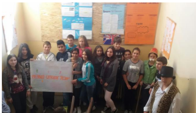
Ученици у Дреновцу – Дан европских језика

Поводом Дана европских језика ученици су кроз интерактивну наставу правили паное и читали о настанку енглеског, руског и српског језика. Тема овогодишње прославе је ИСТОРИЈА ЈЕЗИКА.