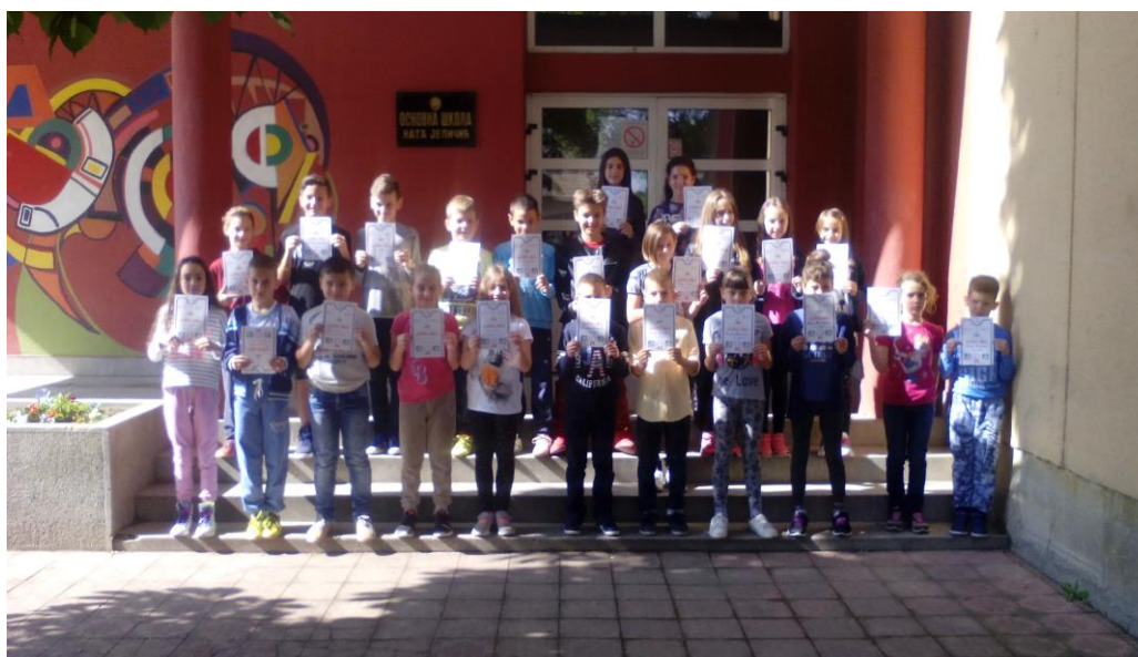
Победници кроса РТС-а – ученици млађих разреда у Шапцу