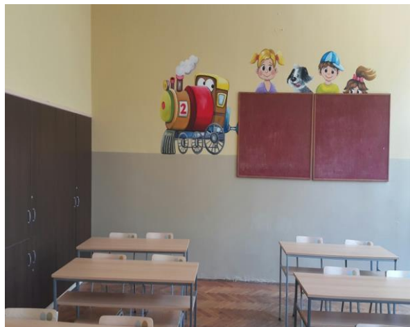
Друга учионица у приземљу