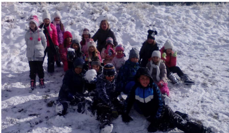
Настава у природи Златибор II/3

Друга смена наставе у природи Златибор – Голија реализована је од 25. новембра до 2. децембра. Ишли су ученици и учитељи: II/1, II/2, II/3, III/1, III/2 и III/4.