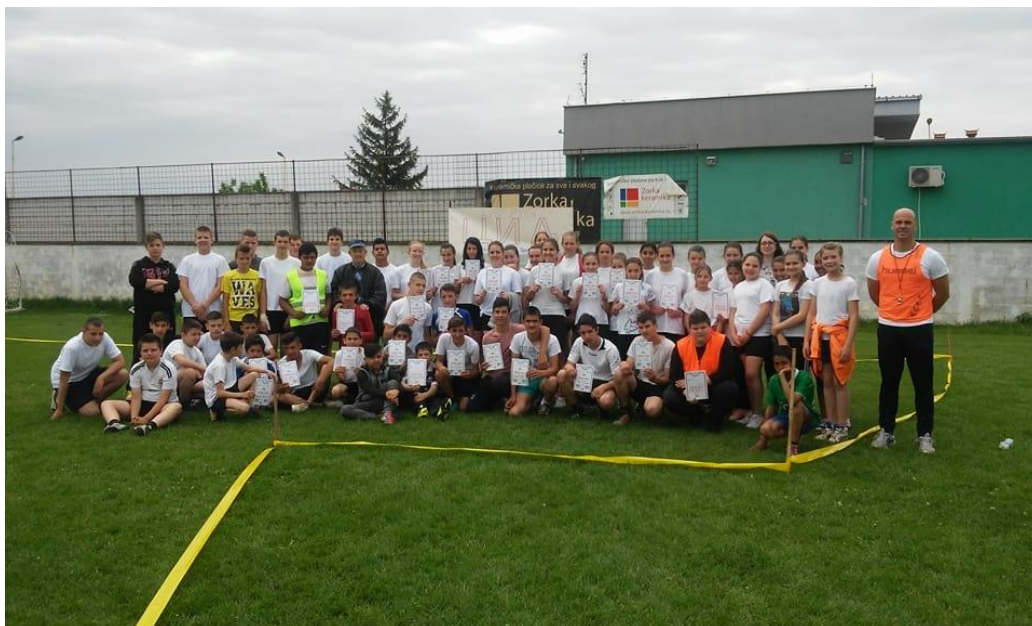
Победници кроса РТС-а – ученици из Дреновца