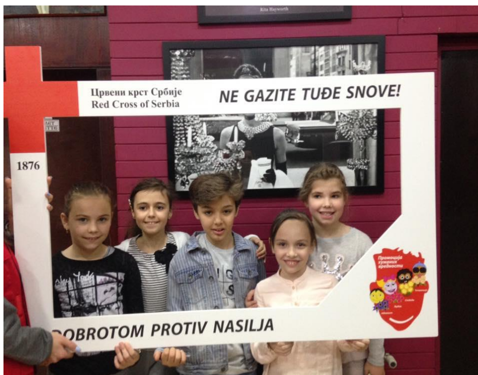
Промоција хуманих вредности

Пробни завршни испит реализован је 7. и 8. априла.