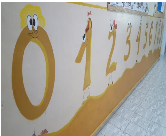
Ходник у Дреновцу