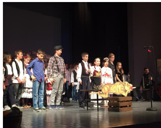
Приредба – Мачванска свадба