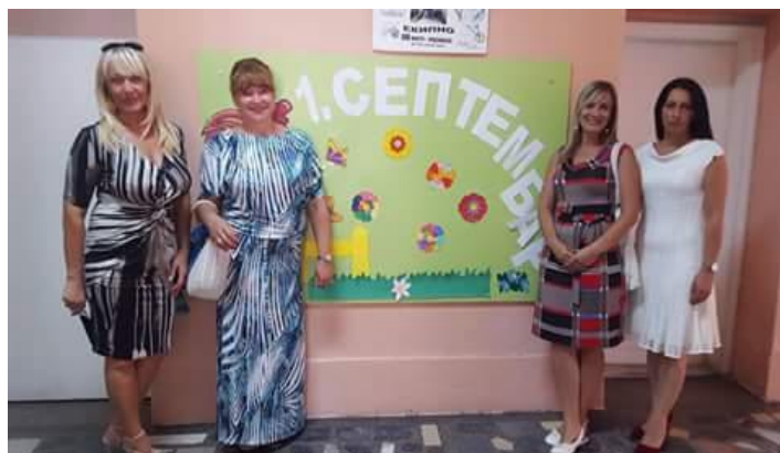
Учитељице 1. разреда