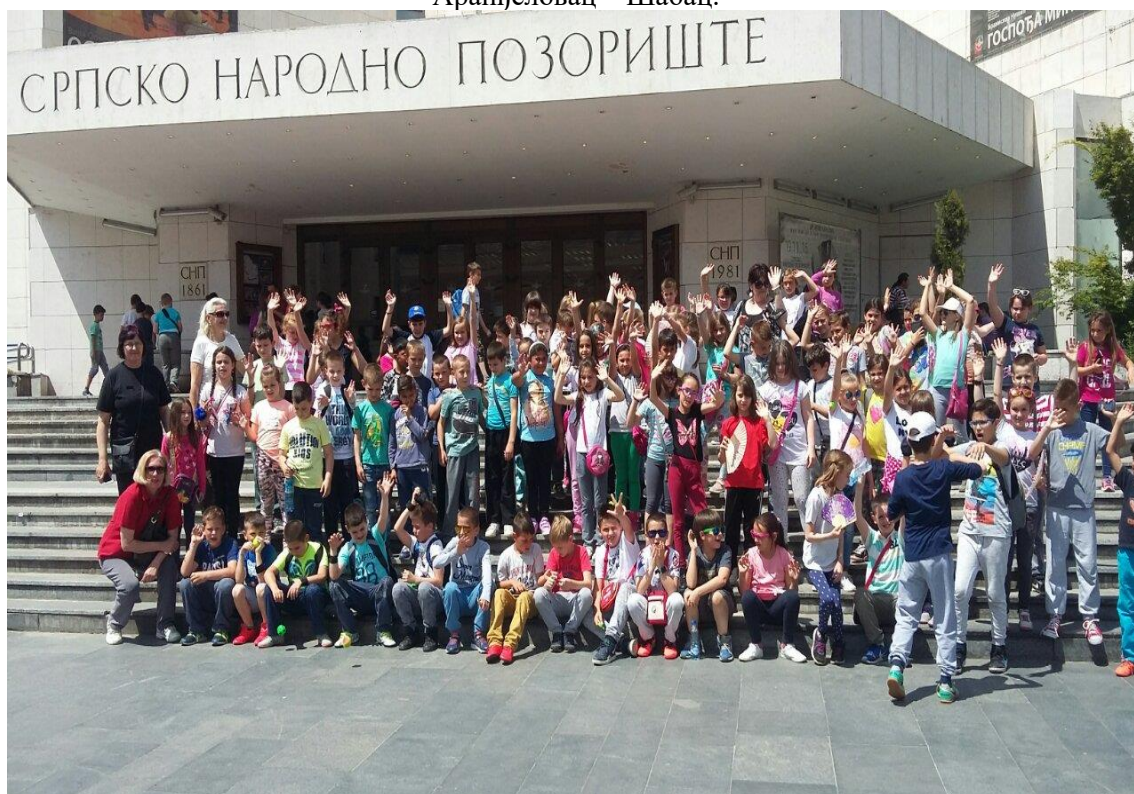
Екскурзија 2. разреда – Нови Сад

Екскурзија 7.разр.(25.5.): Шабац – Ваљево – Топола – Оплењак – Орашац – пећина Рисовача – Аранђеловац – Шабац.