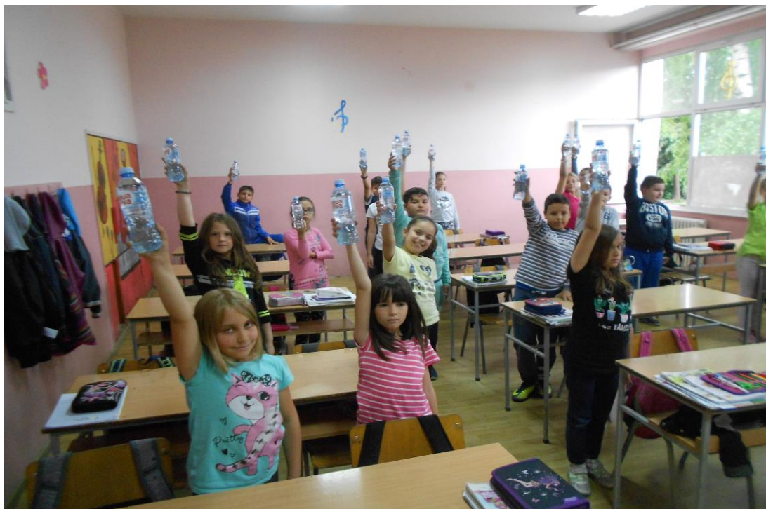
Покренимо нашу децу – вежбе уз Аква виву III/1