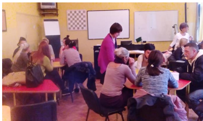
Радионице за родитеље