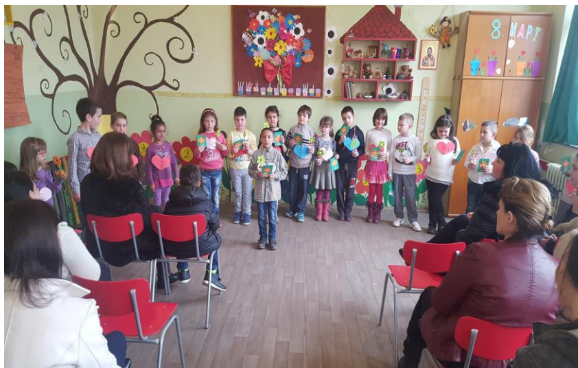
Приредба за Дан жена у I/4

Поводом Дана жена реализовали смо приредбе и правили честитке .