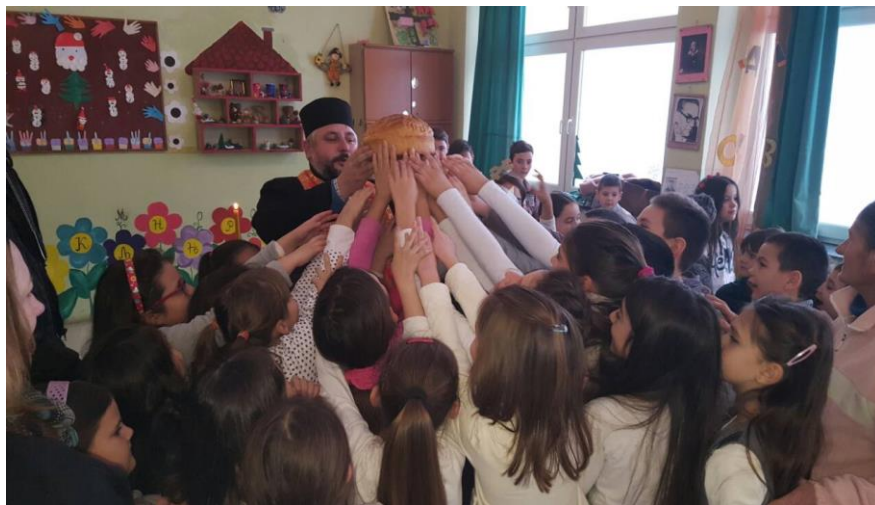
Ломимо славски колач у Дреновцу