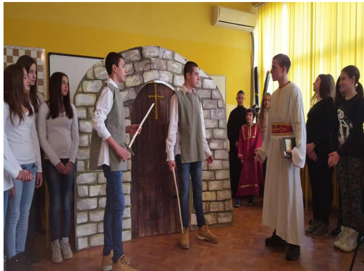
Свети Сава - приредба