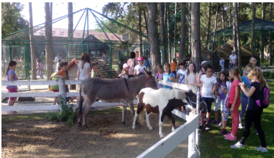
Мали зоо врт у пољопривредној школи

Сарадња са друштвеном средином – Ученици и учитељице 2. разреда су 6. јуна посетили пољопривредну школу. Реализована је амбијентална настава и то часови из света око нас, физичко васпитање, чувари природе, ЧОС и слободне активности. Ученици су видели домаће животиње (где живе, како се хране, ко о њима брине), стакленике цвећа и поврћа, мини воћњак и мали зоо врт.