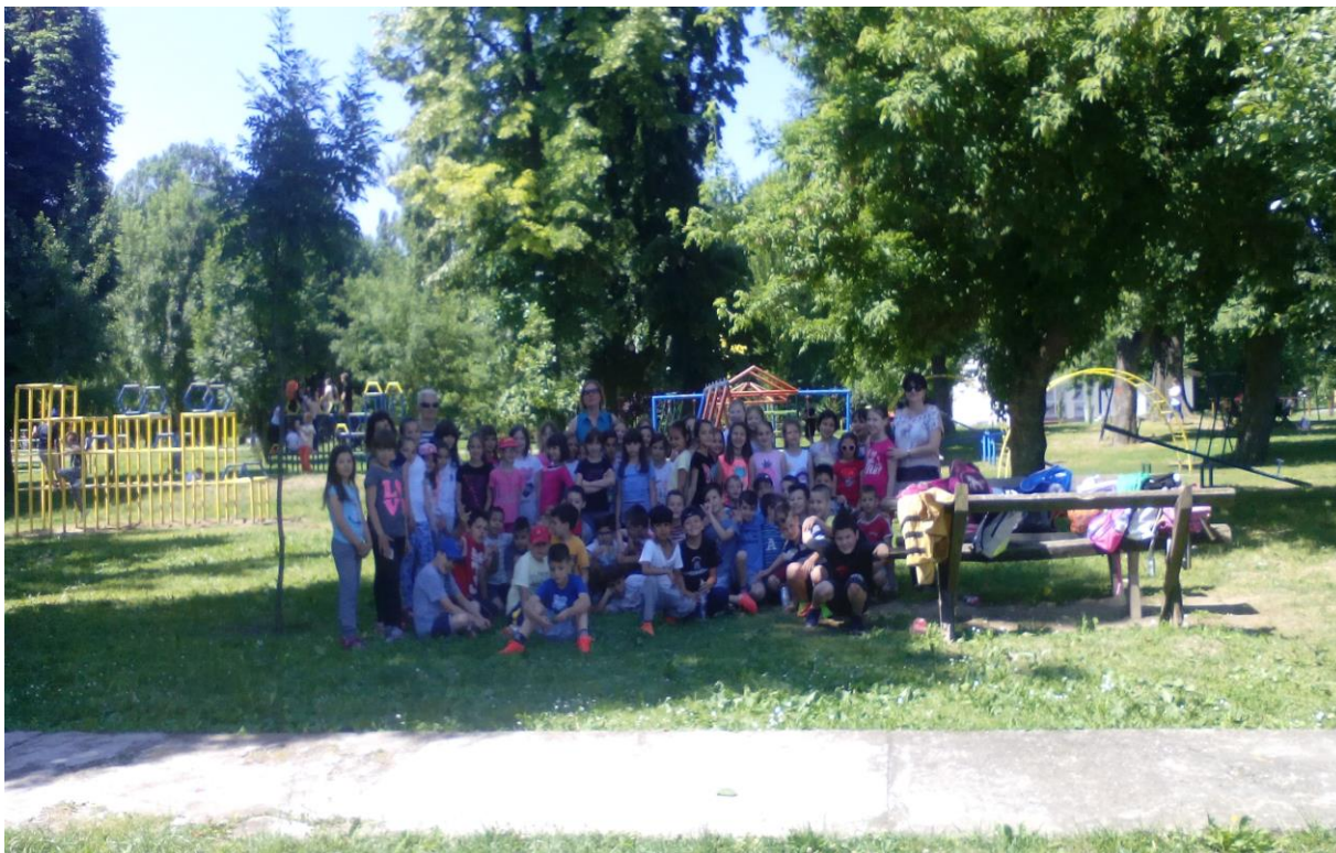
Излет на Старом граду

Квиз – 8. јуна одржан је квиз из енглеског језика. Такмичили су се ученици Ш/2 и Ш/3 одељења, а Ш/3 је било успешније.