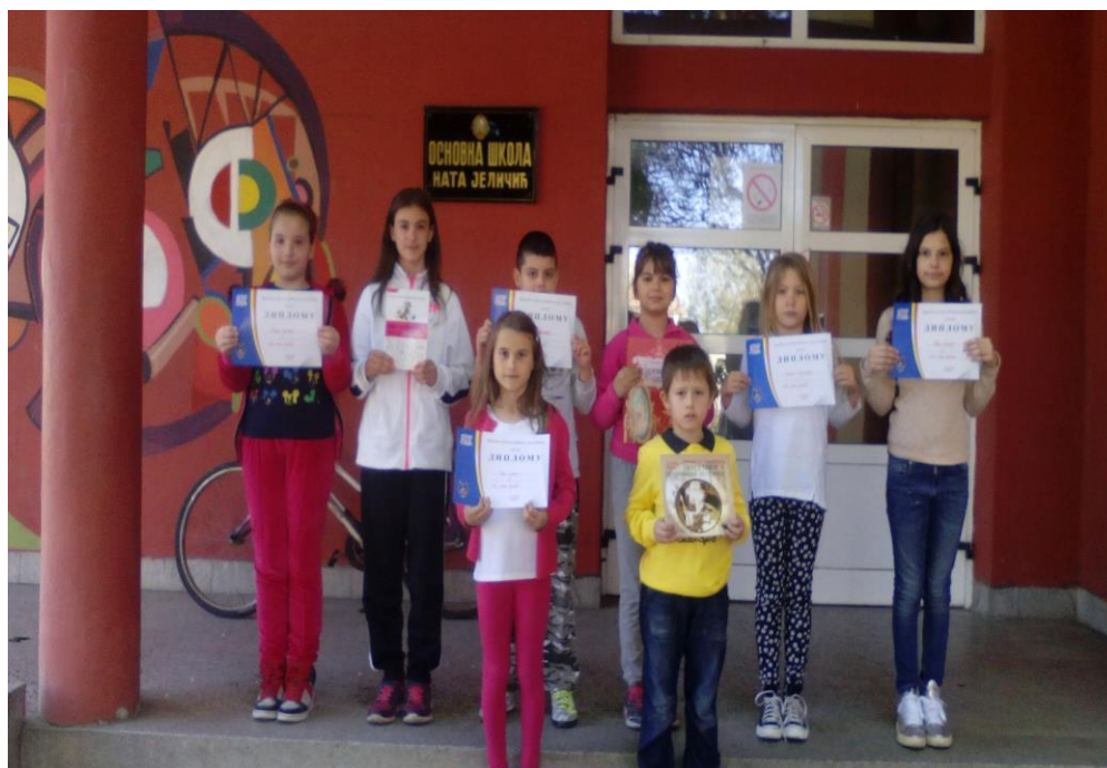
Награђени ученици из ликовног и литерарног конкурса на тему “Мој град”