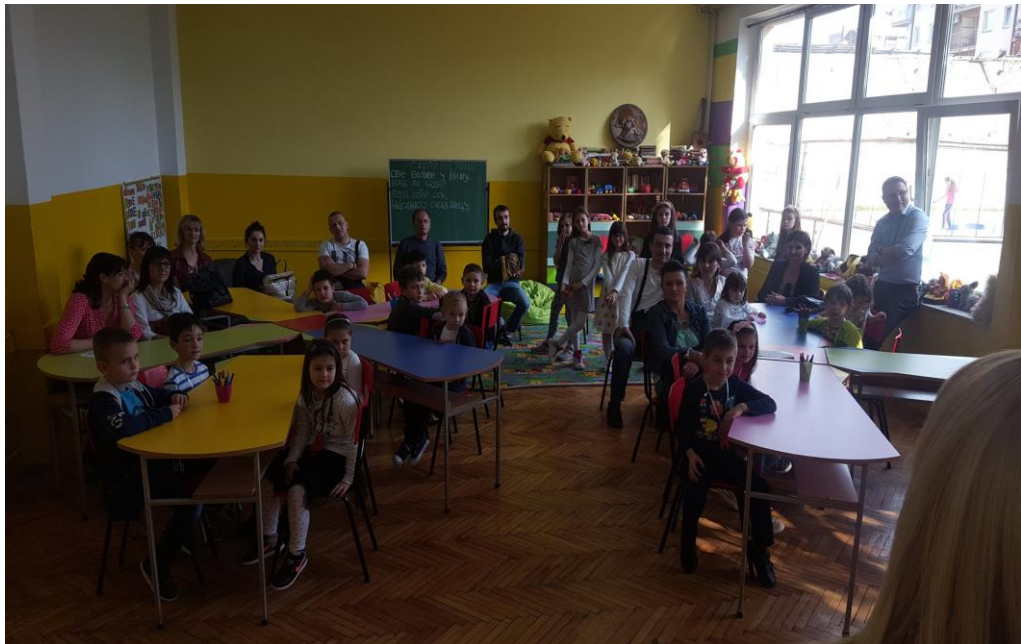
Дан отворених врата за будуће прваке