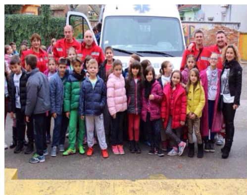
Служба хитне помоћи