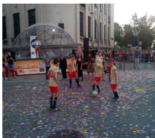
Монтевидео – наступ