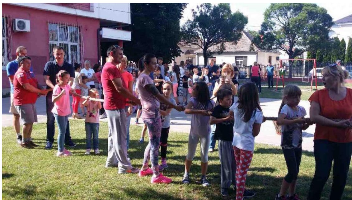
Јавни час – Старе такмичарске игре

Јавни час – Јавни час из народне традиције “Старе такмичарске игре“, реализовале учитељице Ш/3 и I/3 разреда. У играма су учествовали и родитељи. Час је реализован 9. јуна.