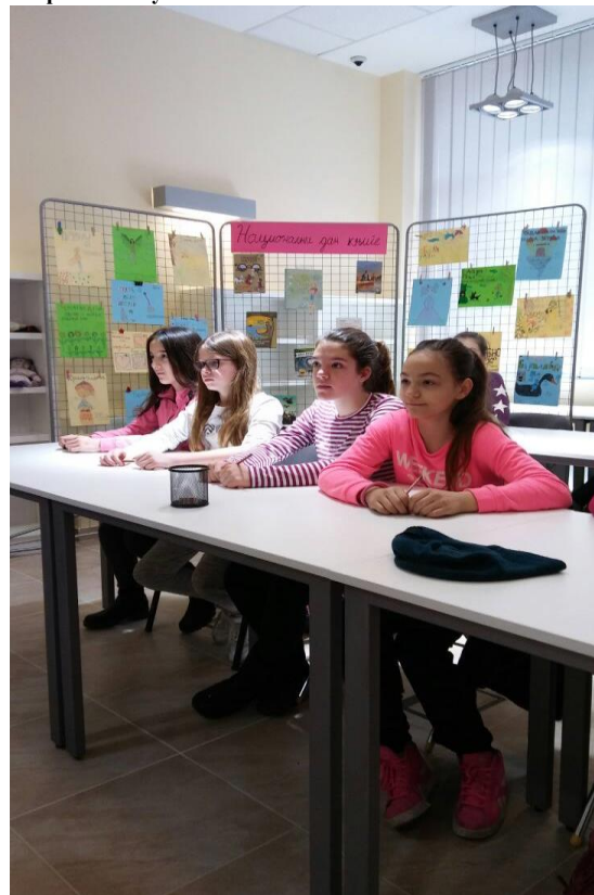
Радионица – Негујмо српски језик