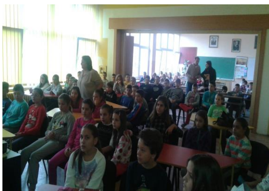
Свака цигарета смета